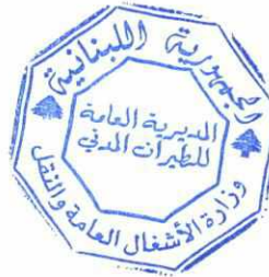
المهندس فادي الحسن